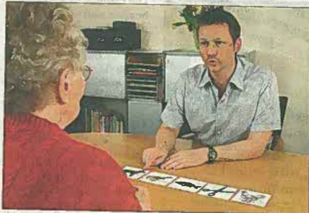
Logopäden behandeln Menschen mit Sprach-, Sprech-, Stimm- und Schluckstörungen, die organisch oder funktionell verursacht werden.

vor. Ursachen hierfür können ein Schlaganfall, eine Hirnblutung, unfallbedingte Hirnverletzungen, Hirntumore, entzündliche Erkrankungen des Gehirns und auch Hirnabbauprozesse sein. Logopäden nennen diese Form der Sprachstörung Aphasie. Logopädische Therapie bei Aphasie umfasst nach einer genauen Diagnostik zunächst die Behandlung der sprachlichen Defizite. Dies wird zumeist in Einzeltherapie unter Einbezug aller Sprachverarbeitungskanäle durchgeführt. Auch realen Kommunikationssituationen müssen sich Betroffene in der Therapie stellen.